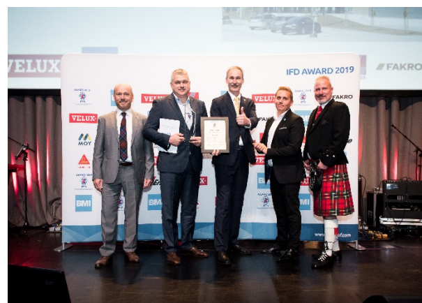
SIA "CMDB", Lettland