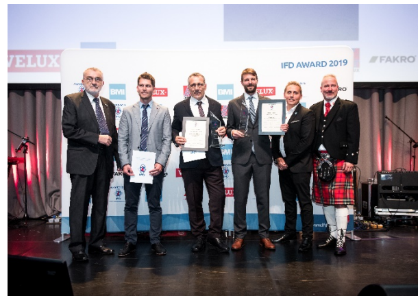
SIA Almont und Heinrich GmbH & Co KG