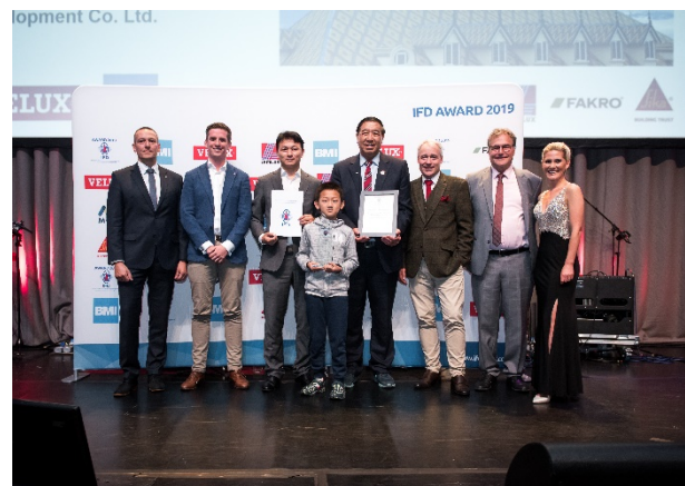
Beijing Hanbo Technology Development Co., Ltd

Nach der Siegerehrung gingen alle Teilnehmer wieder zurück in den Ballsaal. Hier konnte ausgiebig gratuliert werden und Fotos aufgenommen werden.