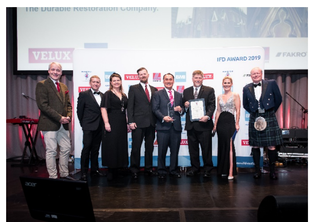
The Durable Restoration Company